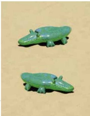
Mar Boerr, DTS

Eine Produktion von FOMP In Kooperation mit Theater am Werk Am 22.05.2026