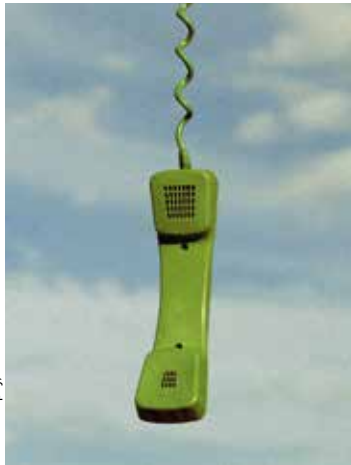
Franco Dupuy, DTS

von Calle Fuhr Eine Produktion des Theater am Werk In Kooperation mit DOSSIER und Schauspielhaus Wien Uraufführung Inszenierung: Calle Fuhr Am 03., 04. und 07.05.2026