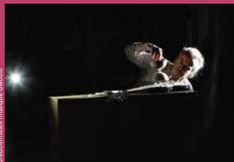
diabolonmusik musique diabolo

Das Duo Müller&Müller breitet sich im großen Saal im Theater am Werk im Kabelwerk aus! Mit dabei: unzählige Diabolo-Schalen, ein Schlagzeugbecken, ein Stab und ein Tisch. Alles dreht sich, wackelt, tanzt, schwingt – und manchmal wird es laut. In dieser Kunstinstallation, die ebenso Performance ist, kann sich das Publikum frei im Raum bewegen und das Geschehen aus nächster Nähe oder aus der Distanz verfolgen.