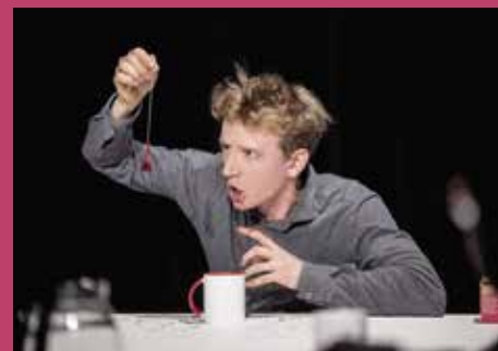
The Story of Larry

Elternschaft und künstlerische Selbstverwirklichung? Ein Balanceakt. Zwei junge Mütter erzählen von ihren (neuen) Identitäten, Perspektiven und Entscheidungen. Inmitten persönlicher Turbulenzen, Wut und Überforderung entfaltet sich zugleich die tiefe Freude über neues Leben – begleitet von den Erwartungen und Urteilen der Außenwelt. Mittels Zirkus, Live-Musik und etlichen Kilogramm Ton fragt die Performance danach, welchen Raum die eigene Kunst einnehmen kann, wenn sich plötzlich alles verändert.