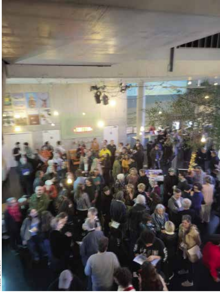
Theater am Werk